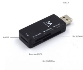
4 Card Slots