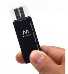
SMALL AND LIGHTWEIGHT