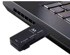
NO DRIVER NEEDED PLUG AND PLAY