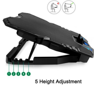
5 Height Adjustment